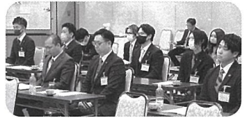
青年部員27名の出席により、慎重なる審議が行われました

令和6年度中標津町商工会青年部通常総会が4月12日(金)にトヨーグランドホテルにて本人出席27名、委任状出席8名、合計35名の出席のもと開催されました。 本総会では、令和5年度の事業報告及び決算報告、令和6年度の事業計画(案)及び事業予算(案)、任期満了に伴う役員改選について可決承認されました。任期満了に伴う役員改選では新たな役員が就任されました。 令和6年度の商工会青年部は「絆」を最高の仲間となり最高の組織となるべく、スロージョーガンに掲げ、部員間の「一人がみんなのためにみんなが一人のために」のスロージョーガンを、地域全体を見据えた「部員一人一人が地域のために」となるよう「絆」を大切に、地域や部員各自の業の発展、将来の地域を担う子供たちの未来そして中標津を含めた地域の更なる躍進の一助となるよう活動して参ります。 今後も地域の皆様、関係諸団体の皆様のご協力を賜りますようお願い申し上げます。